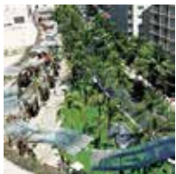
Waikiki Beach Walk