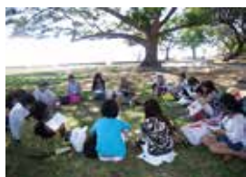
レクチャーの様子②