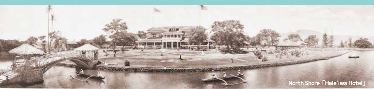
North Shore 「Hale'iwa Hotel」

曲を理解することがとても重要なフラ。例えば、ハワイの美しい景色が歌詞に込められていてもダンサーが歌詞を理解していなければその美しさをフラで表現することは難しくなります。ただ振り覚え、追いかけるだけのフラではなく、大好きなフラをもっともっとステップアップさせ、観る人に感動を覚えて頂けるダンサーへとステップアップしませんか?! このツアーは、ご参加の皆さまが“フラを学ぶ上でとても大切なことは何か?”に気付く機会となって頂くことを願って企画しました。今回も尋ねる先々には、フラダンサーが知りたいこと、知っておくべきことが沢山待ち受けています。フラナビゲーターである大介さんが案内してくれるからこそ、ダンサーにとっての財産となる深い知識を得ることができるのだと思います。ツアーに参加された方はフラ“力”がアップすること間違いなし!