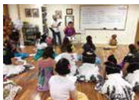
クムによるレッスンの様子