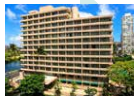
Waikiki Sand Villa