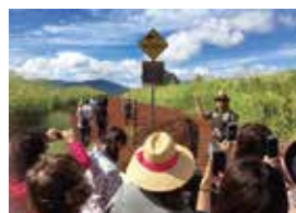
レクチャーの様子①

“もっとフラと真剣に向き合いたい”、“もっと向き合ってみたい”、“向き合っている”皆さまのご参加をお待ちしております!