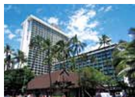
Sheraton Princess Kaiulani